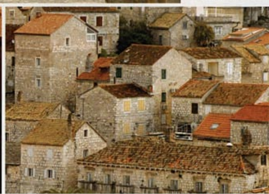
Zimsko lice Hvara u mnogome se razlikuje od onog ljetnog, od kojeg nipošto nije manje vrijedno, a Novogodišnja regata i od ove godine preseljena Uskršnja to će sigurno potvrditi