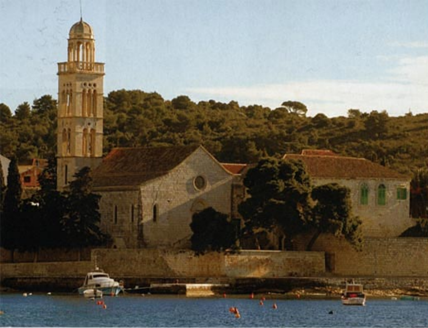
Franjevački samostan jedno je od trajnih hvarskih duhovnih žarišta