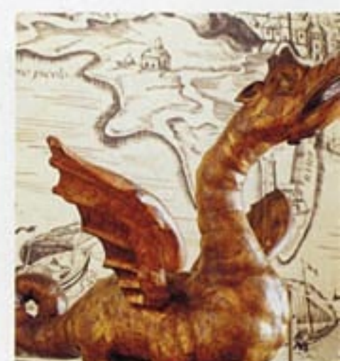
Zvir s hvarske galijske koja je 1571. godine sudjelovala u bitki kod Lepanta zbog obnove Arsenala izložena je u Franjevačkom samostanu

“Mnogima koji uplove u Hvar neshvatljivo je da mjesto s tolikim brojem nautičara nema ama baš ništa, niti pristojnu dizalicu”, kaže Čane i misli kako bi dolazak Uskršnje regate mogao značiti prvi korak ka podizanju kulture jedrenja i plovidbe na Hvaru. Naime,